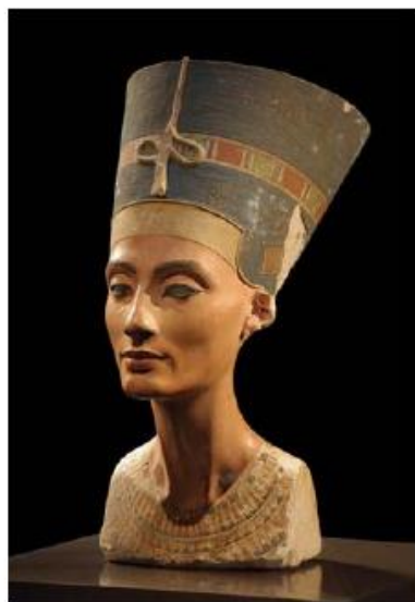
Buste van Nefertiti in het Neues Museum te Berlijn

Achnaton (ca. 1363-1335 v.C.) was een farao van de 18 de dynastie die gehuwd was met zijn nicht Nefertiti en nog 2 andere vrouwen. Het was destijds in Egypte de gewoonte te huwen binnen de familie, met uiteraard inteelt en ongezonde kinderen als gevolg. Hij is gekend als de ketter-koning want hij schafte het traditionele Egyptische meergodendom af met als hoofdgod Amon (ook Amon-Ra genoemd), voerde het monotheïsme in met als enige god de zonnegod Aton, en verplaatste de hoofdstad Thebe (vandaag Luxor) naar het nieuw te bouwen Amarna. Dat was niet eens zo'n gek idee want het leven op aarde hebben we te danken aan de zon. Het was de eerste