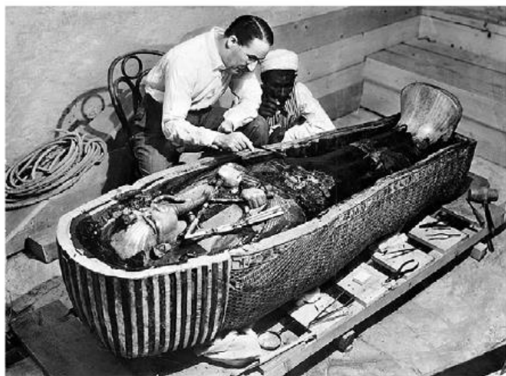
Howard Carter en de sarcofaag van Tutanchamon, 1923

Het graf van Tutanchamon werd in 1922 opgegraven in de Vallei der Koningen (bij Luxor) door de Engelsman Howard Carter (1874-1939), die gesponsord werd door de Engelse mecenas lord Carnarvon (1866-1923). Dat was de meest opzienbarende archeologische vondst van de 20 ste eeuw. Carnarvon overleed 5 maand later en dat was de oorsprong van een hardnekkige legende die zegt dat iemand die het graf van een farao opent zal gestraft worden, de "Vloek van de Farao" genoemd. Het was het enige farao graf dat vrijwel ongeschonden teruggevonden werd; de anderen werden reeds in de oudheid geplunderd. Dit kwam doordat het uitgegraven zand tijdens de bouw van het graf voor Ramses VI op de ingang van het graf van Tutanchamon werd gestort en het daardoor onzichtbaar werd. Carter had 15 jaar gegraven zonder veel te vinden en had de laatste jaren zijn sponsor Carnarvon zwaar moeten bepraten omdat die het wilde opgeven. Hij had 5 jaar vroeger reeds gegraven in een zone tegenover het graf van Ramses VI maar was gestopt toen hij stootte op de resten van oude arbeidershutjes. Ten einde raad groef hij er opnieuw, deze keer door 3 meter sediment dat zich daar gedurende 3000 jaar had opgehoopt, met succes!