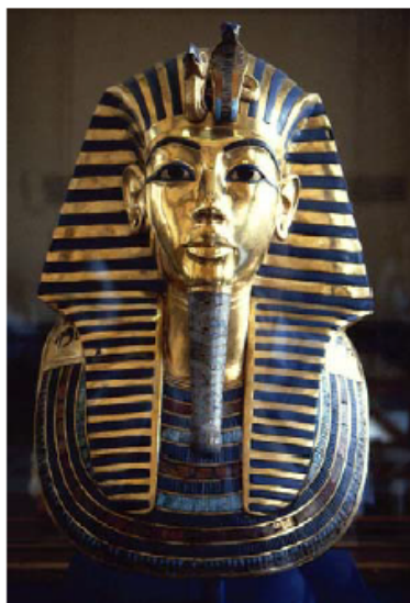
Dodenmasker van Tutanchamon in het Egyptisch Museum te Caïro

Al zijn de Arabieren in Egypte vandaag erg fier over de geschiedenis van hun land, getuige hiervan deze prachtige munt, toch zijn ze niet de afstammelingen van de oude Egyptenaren, want de Arabieren migreerden maar vanuit het oosten naar Egypte (en andere Arabische landen) in de 7 de eeuw. Wel zijn de christelijke Kopten de