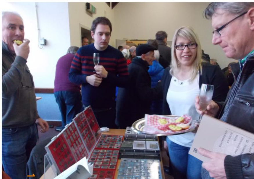
Nieuwjaarsreceptie : munten kijken bij een hapje & een drankje ...